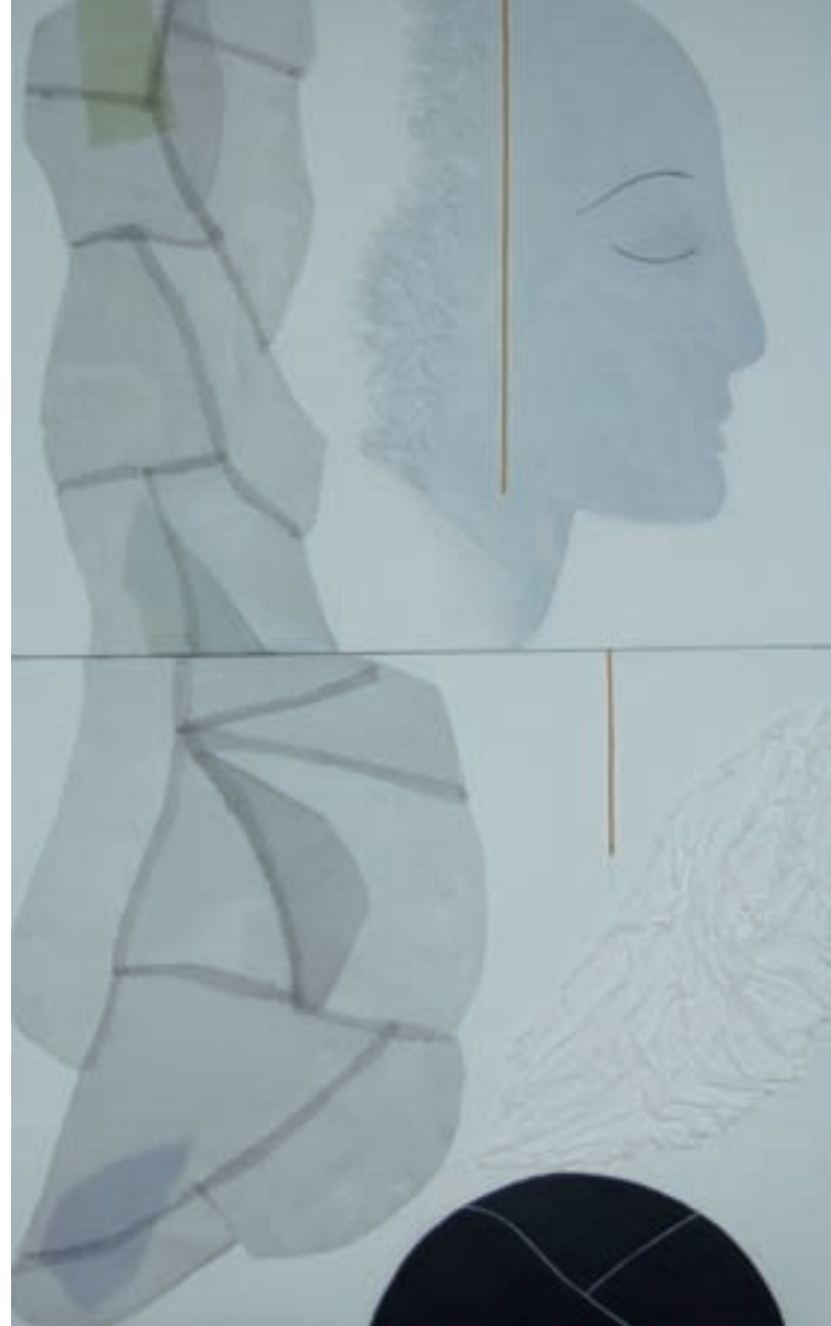
ITZALAREN BARNE 160 x 100 cm. T. Mixta s/tela.