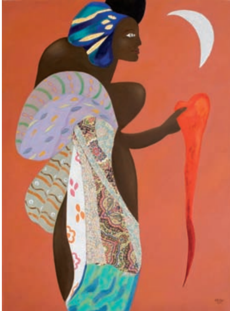
DIOSA AFRICANA Mari beltz 130 x 97 cm. - T. mixta s/tela