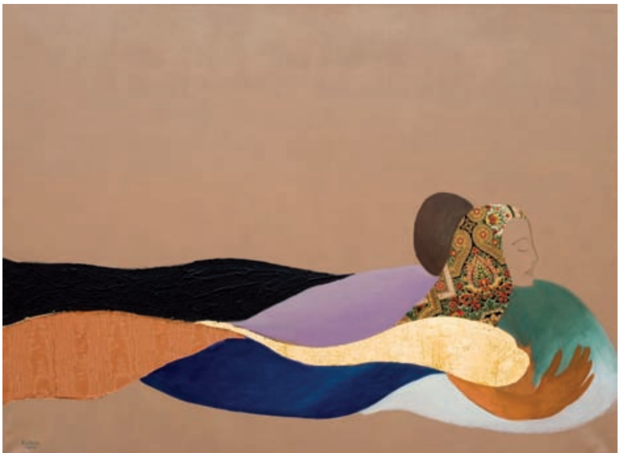
BIHOTZAREN BARNEAN 89 x 130 cm. - T. Mixta s/tela