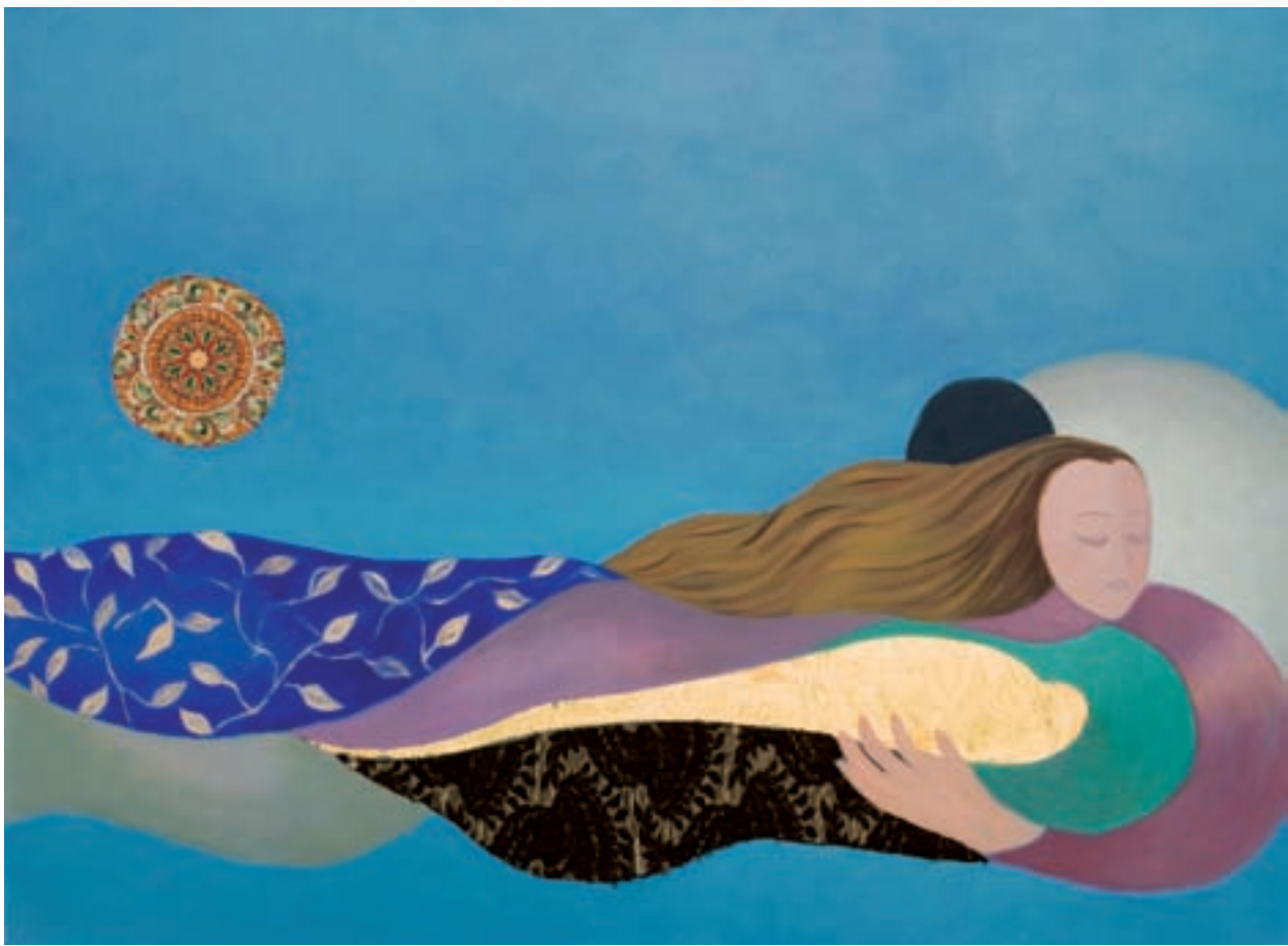
ITSASOKO MARI 97 x 130 cm. - T. mixta s/tela