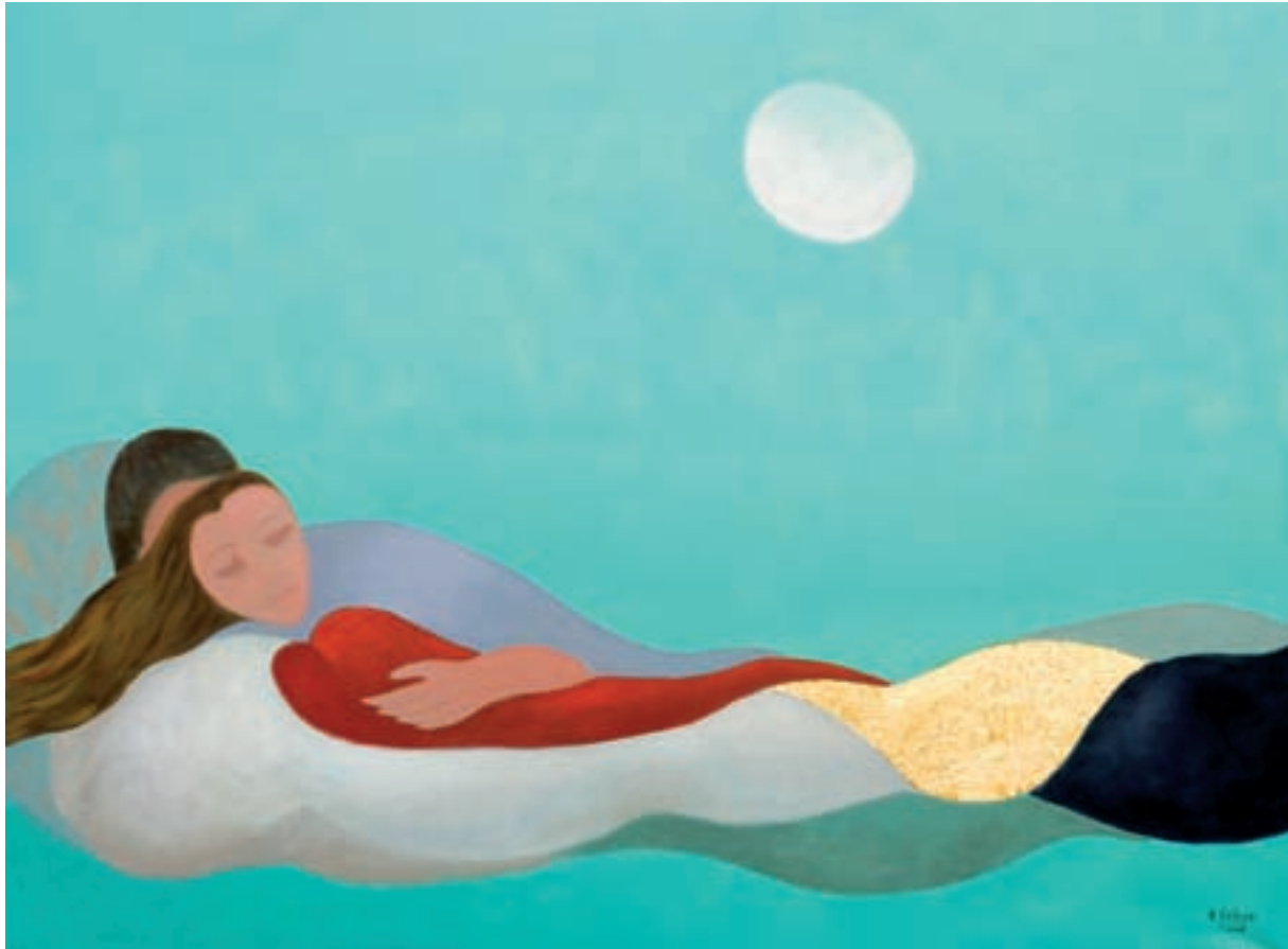
DIOSA DE LAS NUBES Lainoaren Mari 89 x 116 cm. - T. mixta s/tela