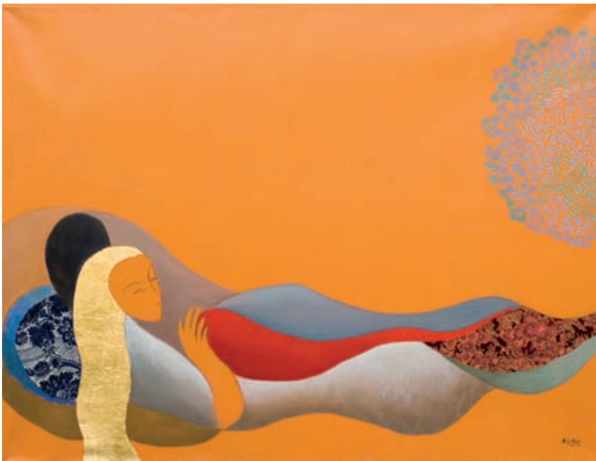
DIOSA JAPONESA Japondiarri Mari 89 x 116 cm. - T. mixta s/tela