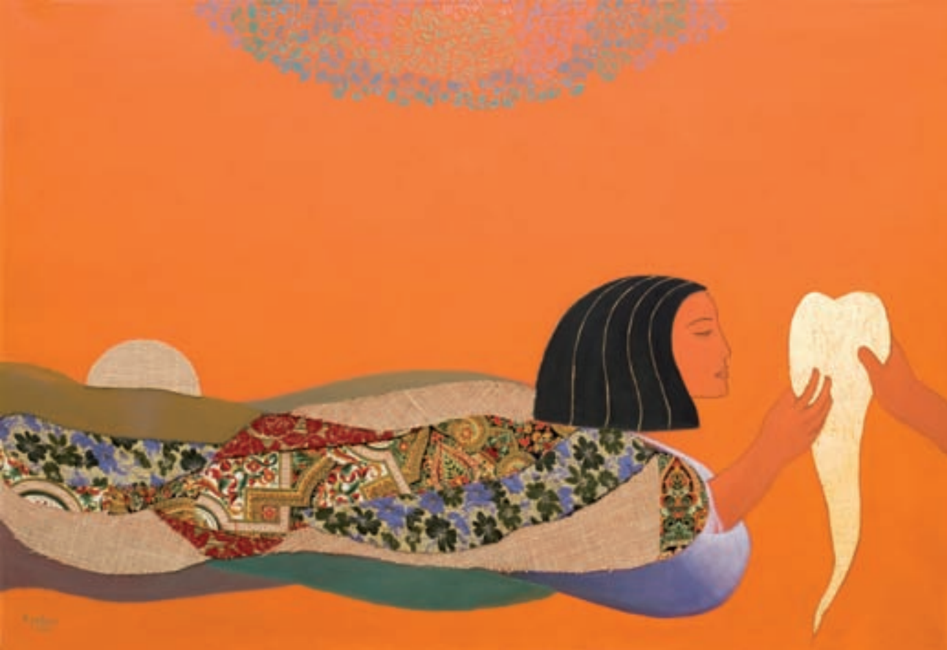
DIOSA EGIPCIA 97 x 130 cm. - T. mixta s/tela