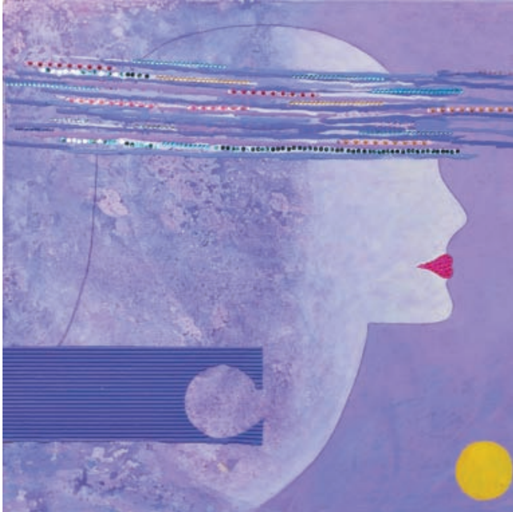
A TRAVÉS DEL CÍRCULO 80 x 80 cm. - T. mixta s/tela