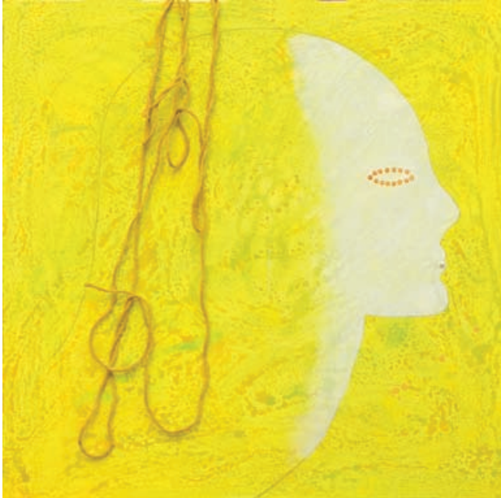
ME SIENTO LIVIANA 80 x 80 cm. - T. mixta s/tela